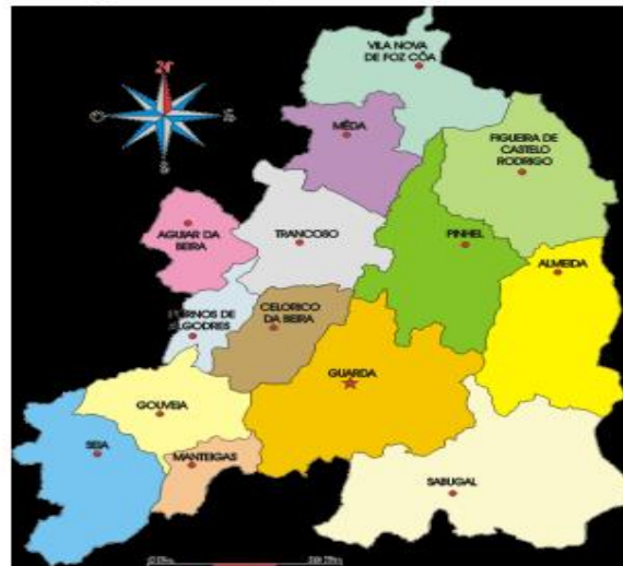
Figura nº 1: Mapa do Distrito da Guarda

A área geográfica de influência da ULSG é extensa, com uma orografia montanhosa e uma densidade populacional baixa. Os maiores aglomerados populacionais encontram-se na cidade da Guarda e de Seia.